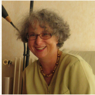
Artiste plasticienne et art-thérapeute,