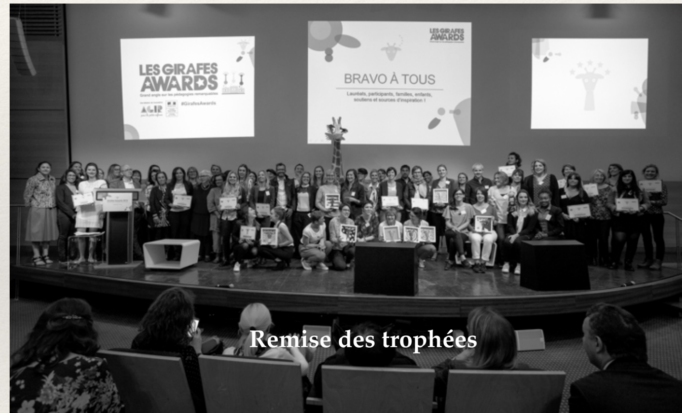
Remise des trophées

Les réunions de jury ont été organisées au Ministère de la Culture et au sein du groupe Marie-Claire Magicmaman partenaires de l'évènement